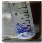
Figure 1. La mycorhization induit une plus grande ramification des racines, ce qui, joint au développement des hyphes très fins du champignon, permet à la plante de mieux explorer le sol.