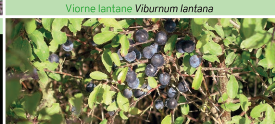
Prunellier Prunus spinosa