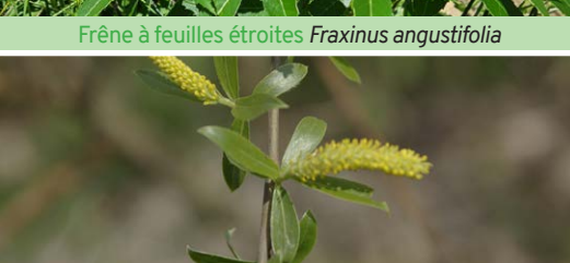
Saule Blanc Salix alba