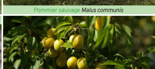
Prunier myrobolan Prunus cerasifera