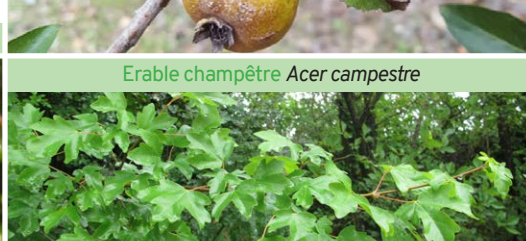
Érable champêtre Acer campestre