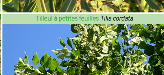
Tilleul à petites feuilles Tilia cordata