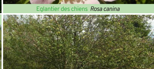
Pommier sauvage Malus communis