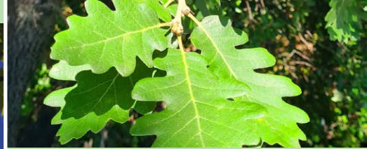
Chêne blanc Quercus pubescens