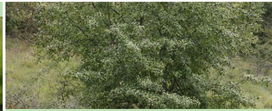
Nerprun purgatif Rhamnus frangula