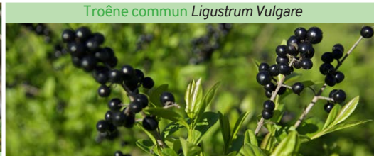
Troëne commun Ligustrum Vulgare