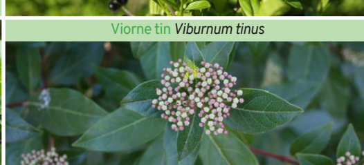
Viorne tin Viburnum tinus