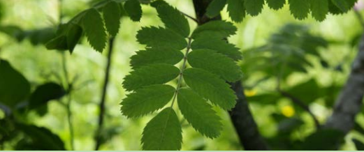
Cormier Sorbus Domestica