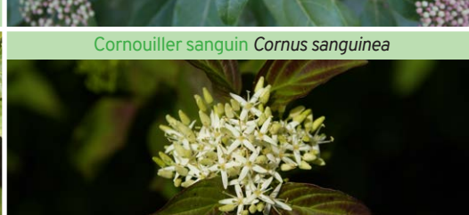
Cornouiller sanguin Cornus sanguinea