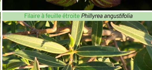
Filaire à feuille étroite Phillyrea angustifolia