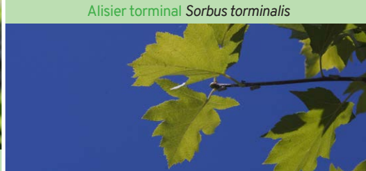
Alisier torminal Sorbus torminalis