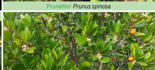
Arbousier commun Arbutus unedo