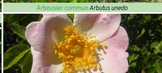
Eglantier des chiens Rosa canina