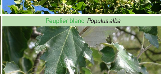
Peuplier blanc Populus alba