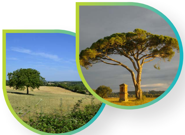
Pin parasol, Tarn