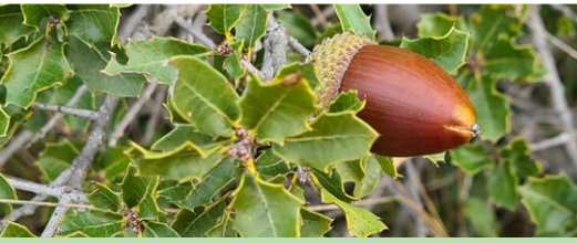
Chêne kermes Quercus ilex