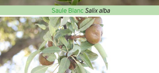
Poirier sauvage Pyrus communis