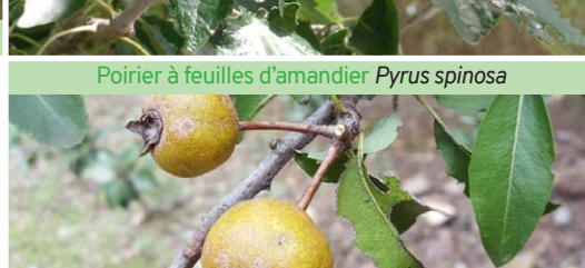
Poirier à feuilles d'amandier Pyrus spinosa